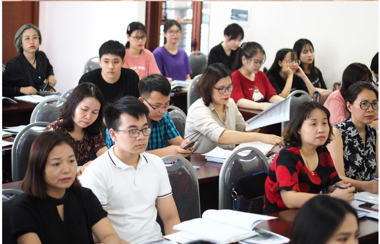
d) Một số hình ảnh khác: