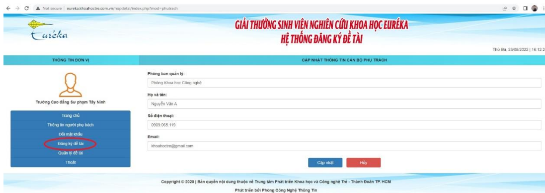
Hình 4: Giao diện đăng ký đề tài

Bước 4: Bấm vào mục “Đăng ký đề tài” và nhập đầy đủ các thông tin mà hệ thống yêu cầu.