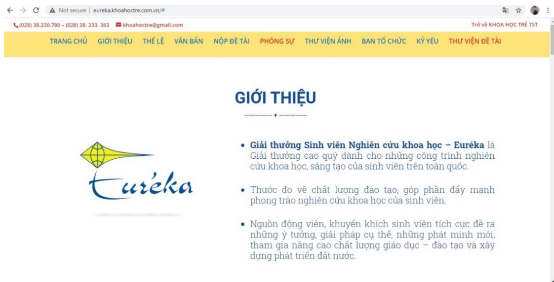
Hình 1: Màn hình đăng nhập

Bước 1: Đăng nhập vào website: http://eureka.khoahoctre.com.vn